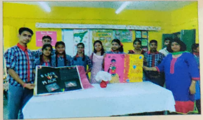
Social Science Exhibition