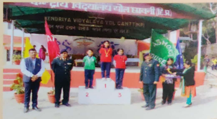
Annual Sports Day