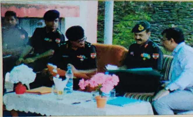
Special Visit by Chief of Army Staff