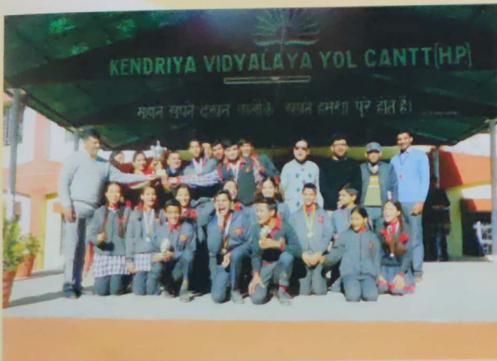
Annual Sports Day