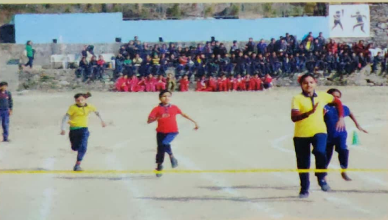
Annual Sports Day