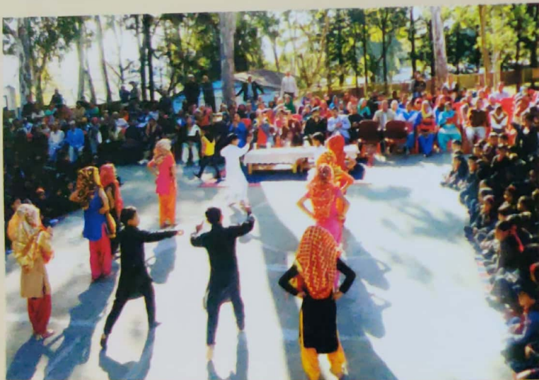
Grand Parents Day