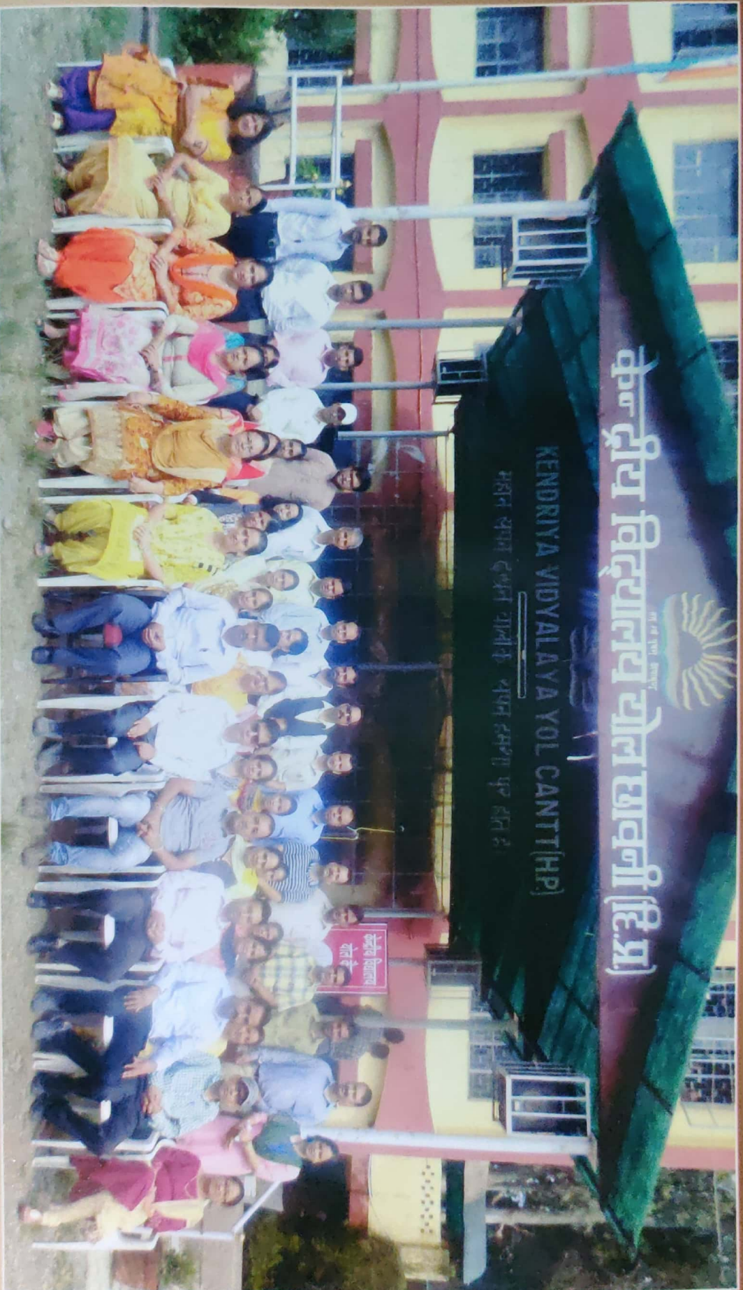
Principal with Staff