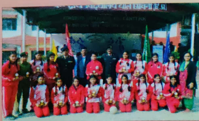
Annual Sports Day