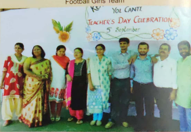
Teacher Day Celebration