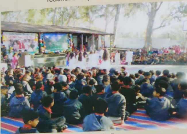
Grand Parents Day