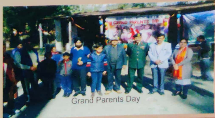
Grand Parents Day