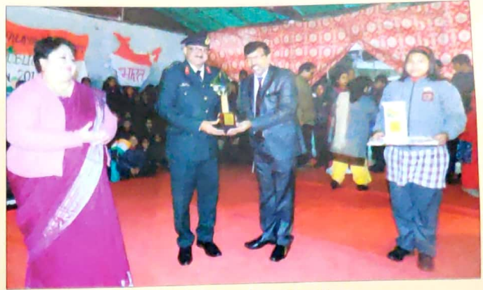
Annual Day Celebration