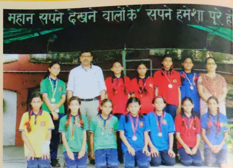
Football Girls Team