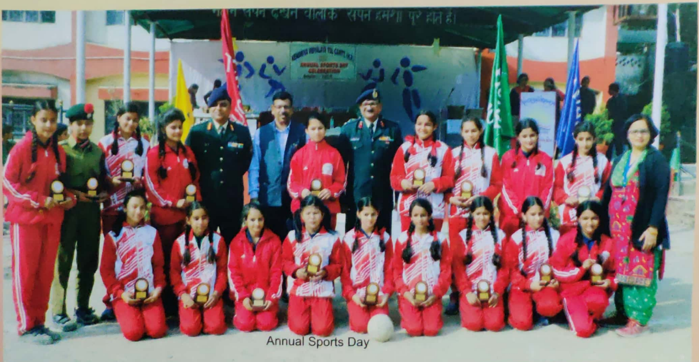
Annual Sports Day