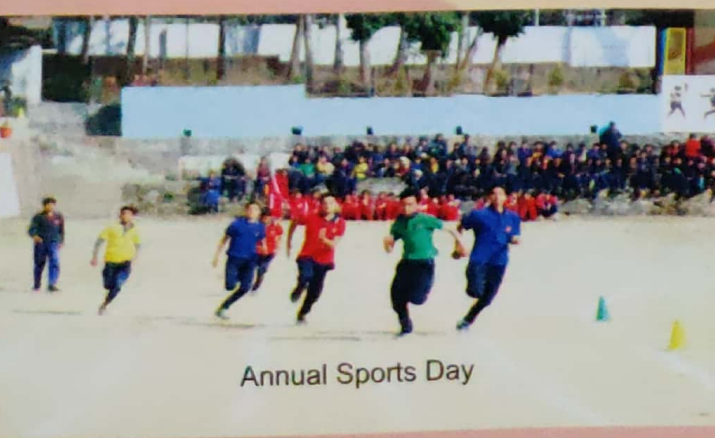
Annual Sports Day