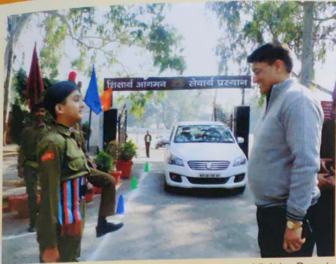
Visit by Deputy Commissioner