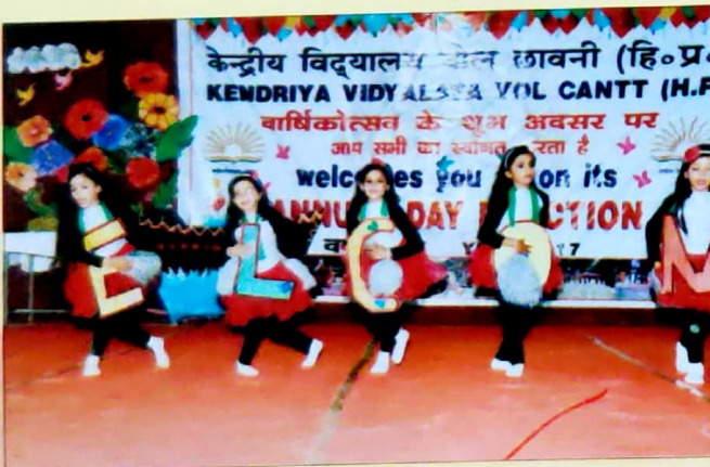
Annual Day Celebration