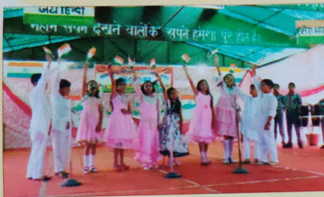
Independence Day Celebration