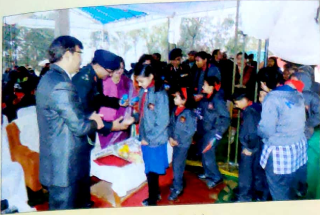
Scouts and Guides