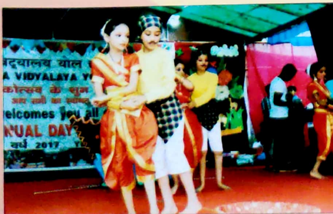
Annual Day Celebration