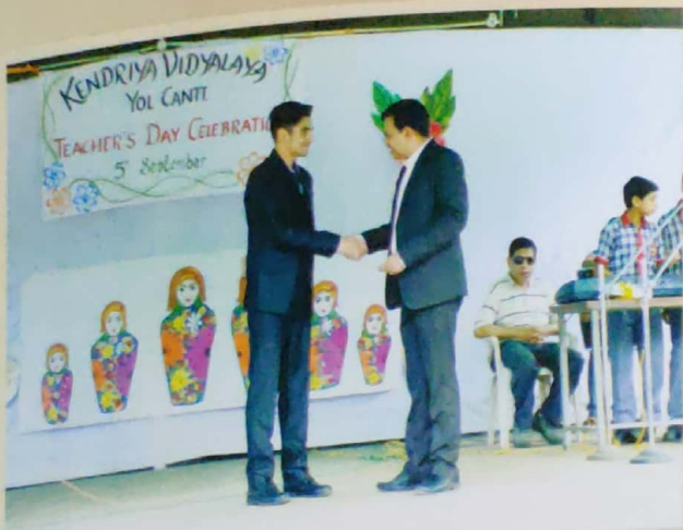
Teacher's Day Celebration